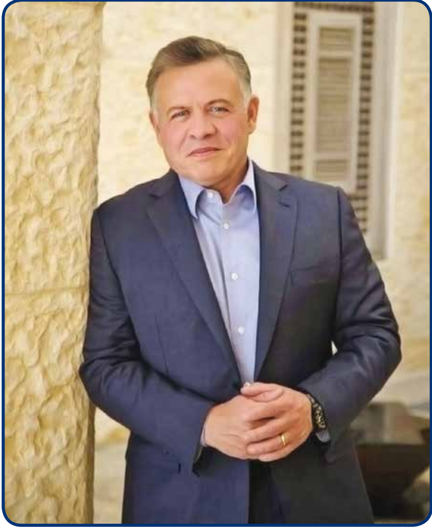
حضرة صاحب الجلالة املك عبدالله الثاني ابن الحسين المعظم