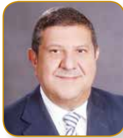
السيد جمال فريز الرئيس