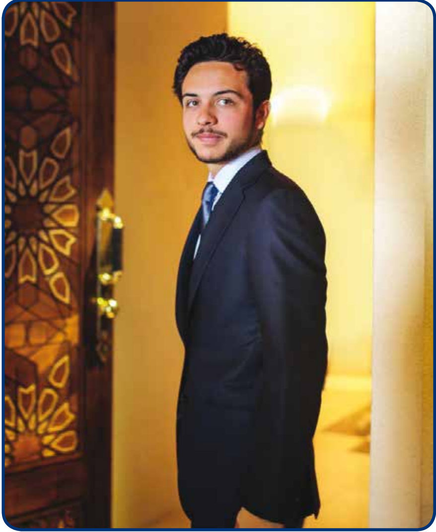
ولي العهد الامير الحسين ابن عبد الله الثاني المعظم